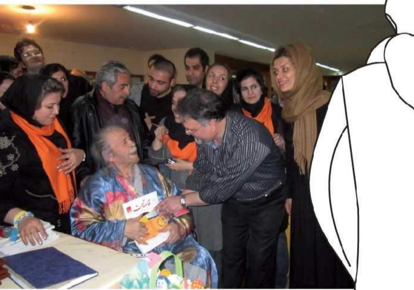
بازارچه خیریه انجمن (اسفند ماه ۹۱)